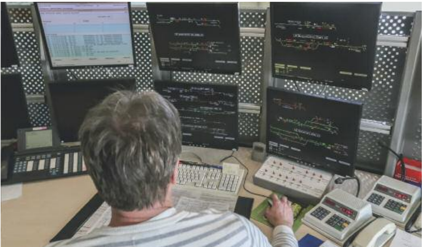
Erstes digitales Stellwerk Europas in Betrieb