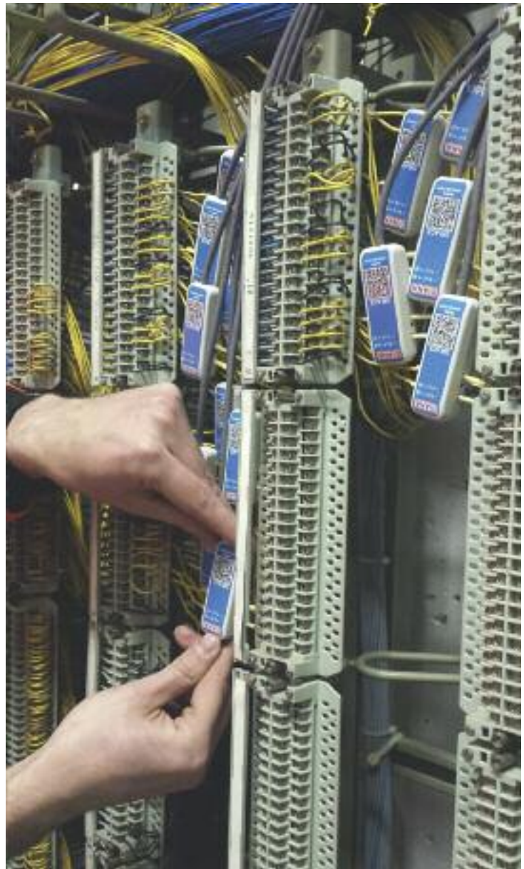
DIANA-Sensoren erkennen frühzeitig Störungen an den Weichenantrieben, bevor sie entstehen.

In einem Pilotprojekt im Rangierbahnhof München-Nord wird seit 2017 die automatisierte und digitalisierte Zugbildungsanlage getestet. Dabei sollen die Prozessschritte Planung, Dispo-