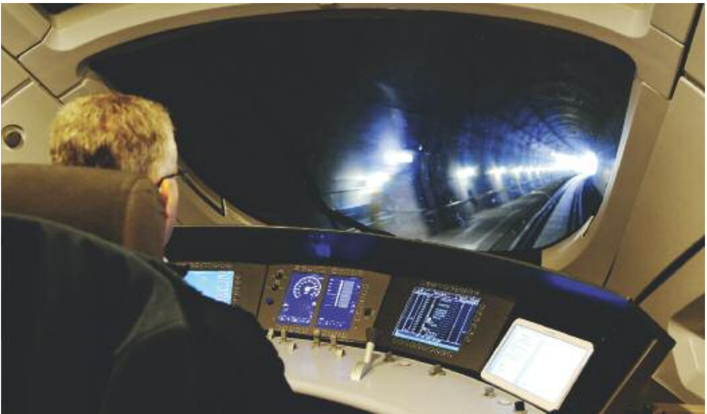
Strecke VDE 8.2 mit ETCS Level 2. Die Züge werden ausschließlich mit Führerstandssignalisierung geführt ohne ortsfeste Hauptsignale an der Strecke.